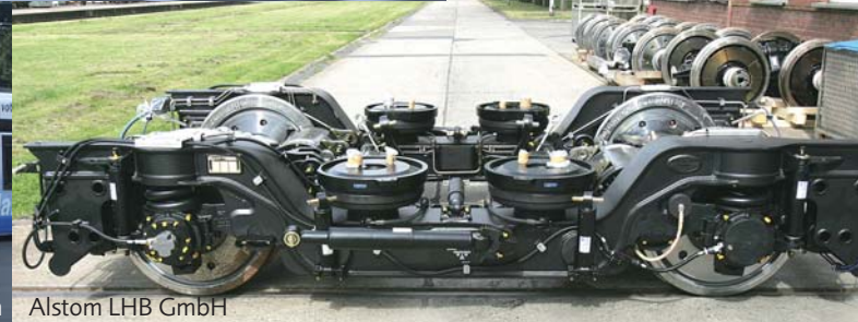
Alstom LHB GmbH