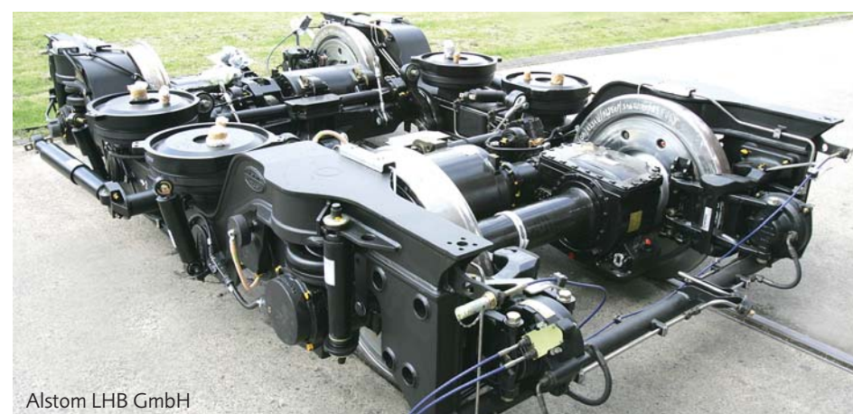
Alstom LHB GmbH

Nous produisons des ressorts pour véhicules ferroviaires depuis la fondation de l'entreprise en 1922. Aujourd'hui, nous bénéficions des homologations de pratiquement toutes les compagnies ferroviaires européennes et nous livrons nos produits à de nombreuses compagnies ferroviaires ainsi qu'à des fabricants de véhicules ferroviaires dans le monde entier. Depuis 1994, nous sommes certifiés DIN ISO 9001, et depuis 1995, nous sommes fournisseur Q1 de la DB AG. Nous sommes ainsi le leader européen de la fabrication de ressorts pour véhicules ferroviaires.