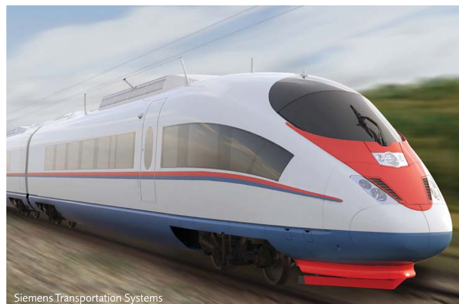
Siemens Transportation Systems

matériaux, de la conception et du dimensionnement est aussi importante que la précision de la fabrication pour garantir un fonctionnement impeccable et une grande longévité. L'utilisation de commandes numériques permet d'atteindre un niveau élevé de reproductibilité et de flexibilité qui garantit une production économique, même pour la fabrication de petits lots. Tous les paramètres