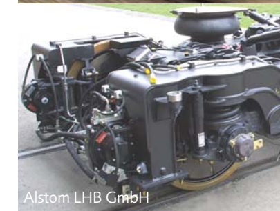
Alstom LHB GmbH