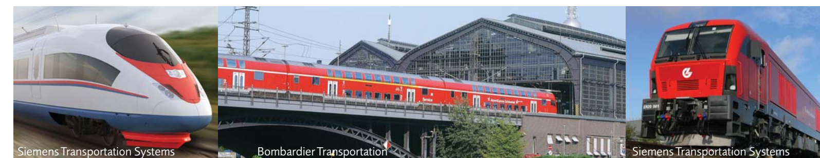
Siemens Transportation Systems

Langen & Sondermann GmbH & Co. KG Federwerk Bergkampstraße 57, D-44534 Lünen, Allemagne P.O.BOX 1626, D-44506 Lünen, Allemagne Tél. ++49 23 06 / 7 50 57-0 Fax ++49 23 06 / 5 76 72 www.langen-sondermann.de post@langen-sondermann.de