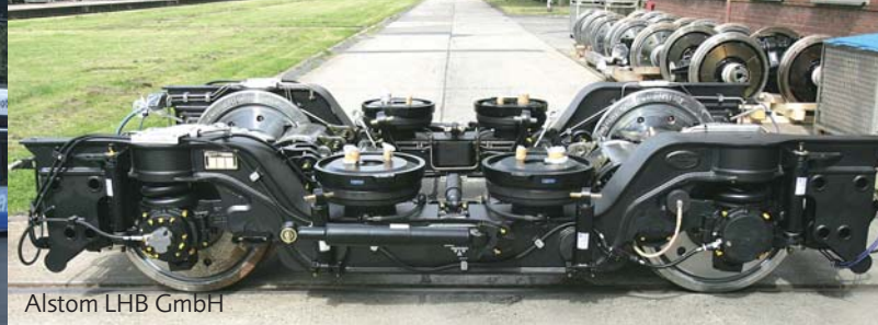
Alstom LHB GmbH