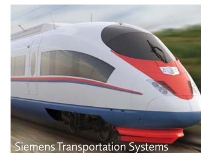
Siemens Transportation Systems