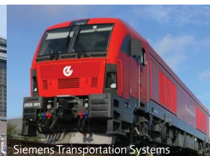
Siemens Transportation Systems