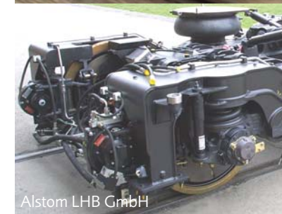
Alstom LHB GmbH